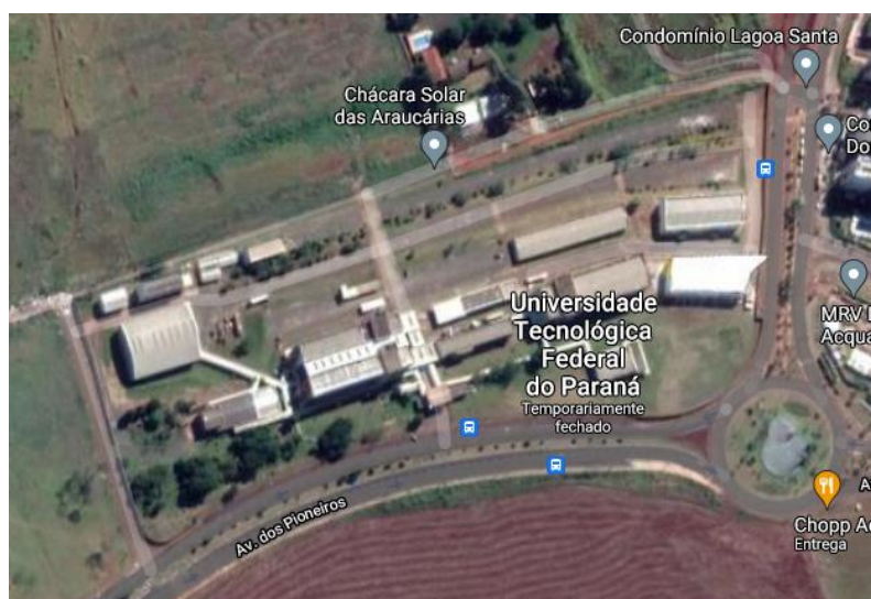
Figura 01: Vista aérea do Campus Londrina da UTFPR.

O Campus Londrina da UTFPR foi implantado na cidade no ano de 2007, em uma sede provisória. Em 2009, transferiu-se para a atual sede, que conta com um terreno de 74.000 m 2 (Figura 1), onde são ofertados sete cursos de graduação: Tecnologia em Alimentos, Engenharia Ambiental, Engenharia de Materiais, Engenharia Mecânica, Engenharia de Produção, Engenharia Química e Licenciatura em Química, além de diversos cursos de pós-graduação, totalizando cerca de 2500 estudantes e pouco mais de 200 servidores.