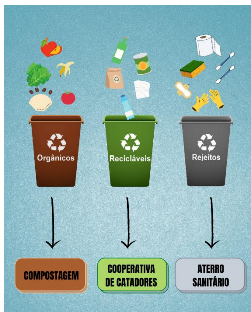
Figura 02: Rota dos resíduos sólidos na UTFPR Londrina.

Campus. Os resíduos são segregados em três lixeiras: recicláveis (verde), orgânicos (marrom) e rejeitos (cinza). Os recicláveis são doados à Cooperativa de catadores, em cumprimento ao Decreto n. 5.940/2006 (BRASIL, 2006); os orgânicos são compostados em composteiras comerciais de 500 L e os rejeitos são destinados ao aterro sanitário.